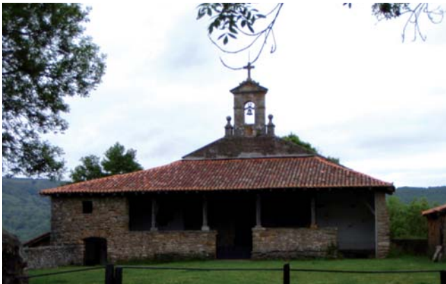
Ermita de Garrastatxu