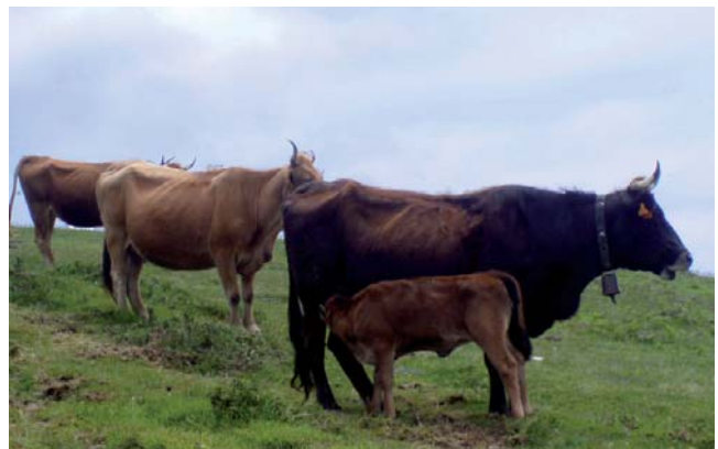
Vacas pastando cerca de Nafakorta