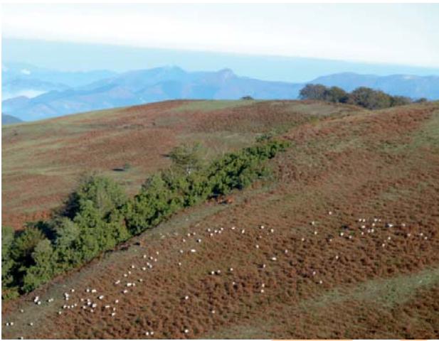
Rebaño de ovejas en los brezales junto al arroyo Antsoleta

[KM 6,5] ODERIAGA. Desde el cruce Katxabaso, tomando la pista arreglada que asciende a la izquierda, el camino se adentra en el Parque Natural de Gorbeia ofreciendo espectaculares vistas sobre el valle de Ayala. Pasando por Nafarkorta tomamos la sinuosa línea de cumbres a caballo entre las provincias de Álava y Bizcaia, dominando el valle de Orozko. Desde Oderiaga, débiles caminos rodados que saltan entre densos pastizales nos conducen hasta el refugio de Ángel Sopena, en las campas de Arraba.