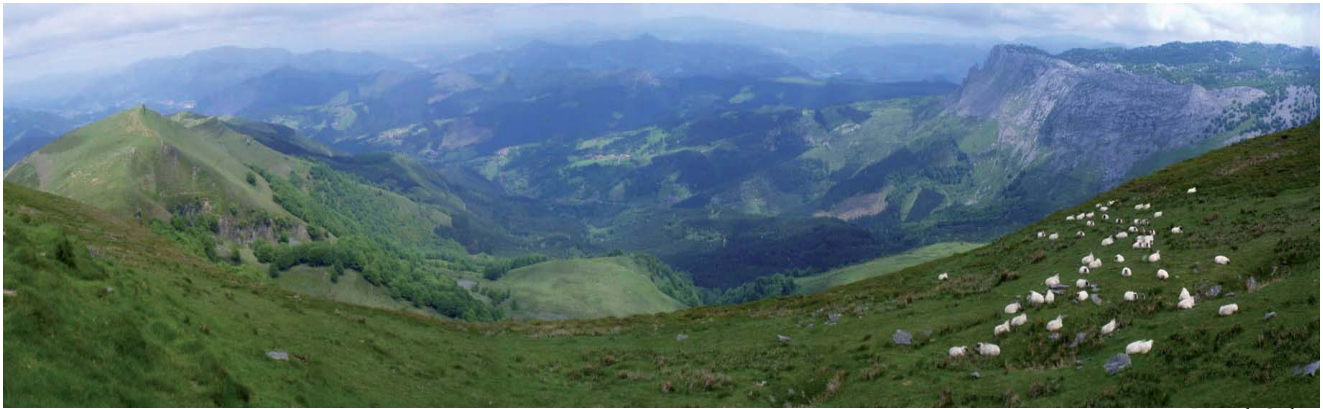
Pastos de Gorbeia