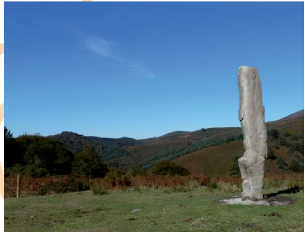
Menhir de Arlobi