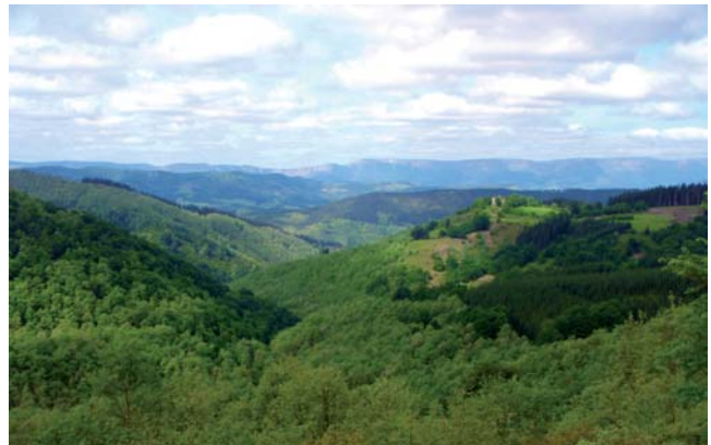
Bosques de frondosas en primer plano y Sierra Salvada de fondo